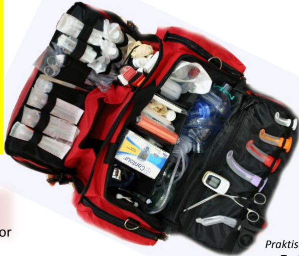
Praktische Notfalltasche Textil, leicht, stabil ,flexibel und kompakt .