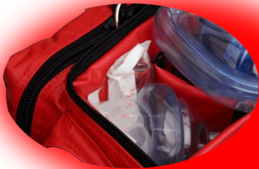
i.v. - Infusion